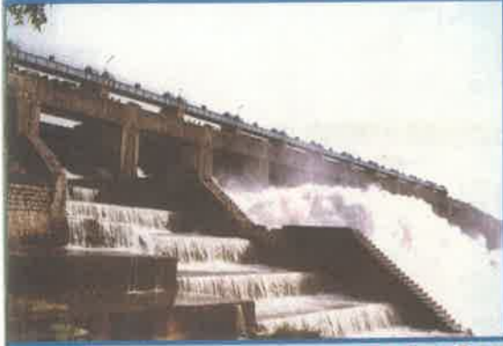
నిజాం సాగర్, నిజామాబాద్ జిల్లా