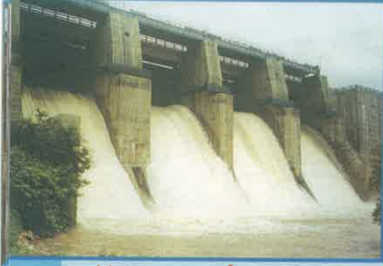
వరదరాజ స్వామి గుడి ప్రాజెక్టు, కర్నూలు జిల్లా