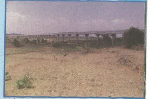
తలిపేరు ప్రాజెక్టు, ఖమ్మం జిల్లా