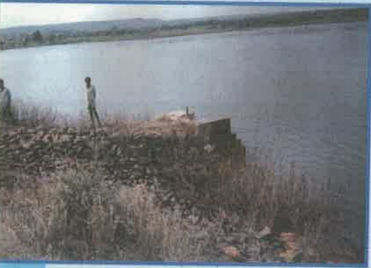
మంగళమడుగు వాగు, మర్చి మంలి, రంగారెడ్డి జిల్లా