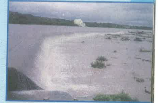
ఘనాపూర్ ఆనకట్ట, మెదక్ జిల్లా