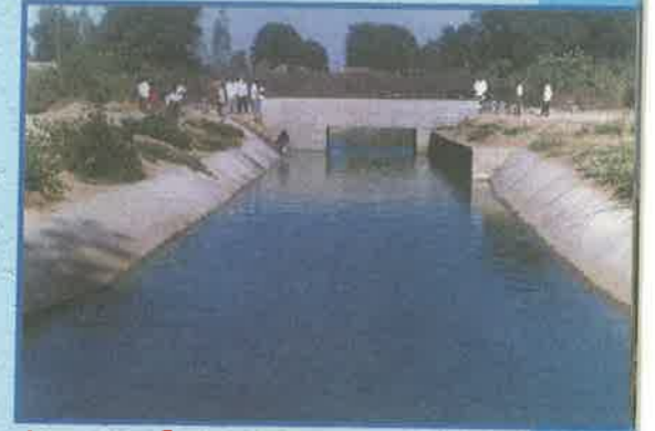
సంగం ఛానల్ పునర్నిర్మాణ పనులు

★ భారీ, మధ్య తరహా ప్రాజెక్టులకు అవకాశం లేని మెదక్, రంగారెడ్డి, విజయనగరం, అనంతపురం, చిత్తూరు, ప్రకాశం జిల్లాలలో మైనర్ ఇరిగేషన్ పథకాలకు ప్రభుత్వం ప్రత్యేక ప్రాధాన్యత ఇస్తున్నది.