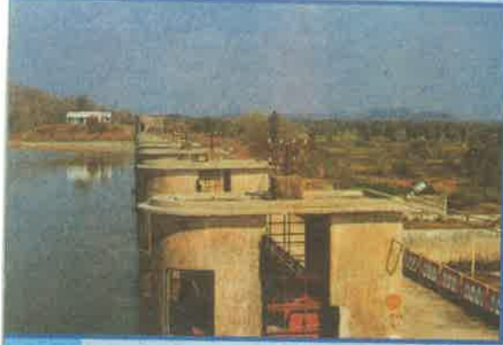
కడం, ఆదిలాబాద్ జిల్లా

★ నిర్మాణంలోగల పలు ప్రాజెక్టులను నిర్ణీత కాల వ్యవధిలో పూర్తి చేసి 2005 నాటికి కొత్తగా 15 లక్షల ఎకరాలకు సాగునీరు కల్పించడానికి ప్రభుత్వం కృషి చేస్తోంది.