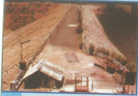
తాండప ప్రాజెక్టు, విశాఖపట్నం