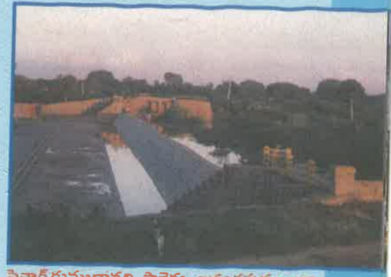
పెన్నార్ కుముదావతి ప్రాజెక్టు, అనంతపురం జిల్లా