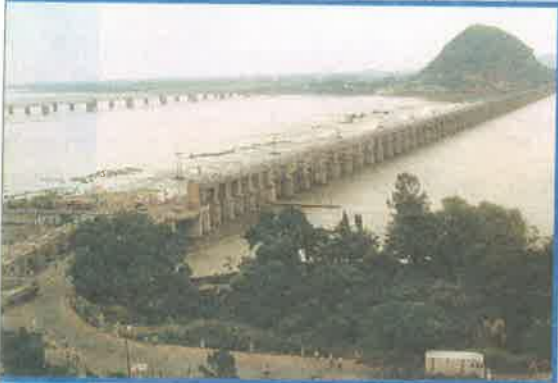
ప్రకాశం బ్యారేజీ, విజయవాడ

వృధాగా సముద్రం పాలవుతున్న గోదావరి జలాల వినియోగానికి తెలుగుదేశం ప్రభుత్వం దేవాదులతో సహా పలు ఎత్తిపోతల ప్రాజెక్టులను చేపడుతోంది. ప్రాజెక్టుల నిర్మాణంలో ఎదురయ్యే అంతరాష్ట్ర సమస్యల పరిష్కారానికై “గోదావరి నదీ జలాల వినియోగ సంస్థ”ను ఏర్పాటు చేసింది. కర్ణాటక ప్రభుత్వం కృష్ణానది ఎగువన ఆలమట్టితో పాటు పలు ప్రాజెక్టులను నిర్మించడంతో గత రెండేళ్లుగా మన రాష్ట్రం తీవ్ర నీటి ఎద్దడిని ఎదుర్కొంటోంది. ఈ విషయంలో కూడా స్థానిక కాంగ్రెస్ నాయకులు రాష్ట్ర శ్రేయస్సుకు భంగం వాటిల్లే విధంగా భిన్నాభిప్రాయాలు వ్యక్తం చేస్తున్నారు. కర్ణాటక నుంచి 50 టిఎంసిల నీటిని మన రాష్ట్రానికి విడుదల చేయించడానికి ప్రభుత్వం చేస్తున్న ప్రయత్నాలకు స్థానిక కాంగ్రెస్ నాయకులు సహకరించడం లేదు.