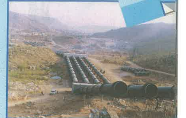
స్టాబ్ లిఫ్ట్ స్కీమ్