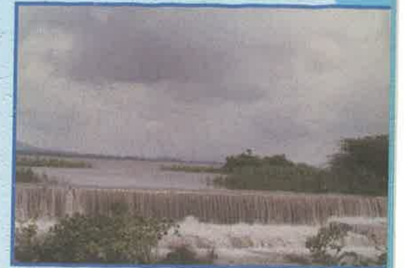
వైరా ప్రాజెక్టు, ఖమ్మం జిల్లా