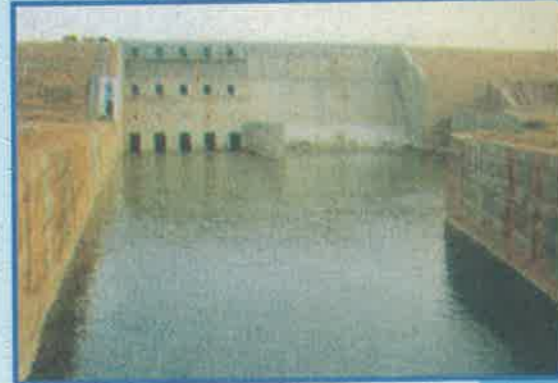
కందలూరు, చిత్తూరు జిల్లా