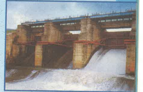
వెంగళాయ ప్రాజెక్టు, విజయనగరం

★ వచ్చే సీజన్ కల్లా 7 వేల ఎకరాలకు నీరు అందించే విధంగా లోలెవల్ కెనాల్ పూర్తి చేయడానికి రూ. 7 కోట్లతో అదనపు పనులు మంజూరు చేయడం జరిగింది.