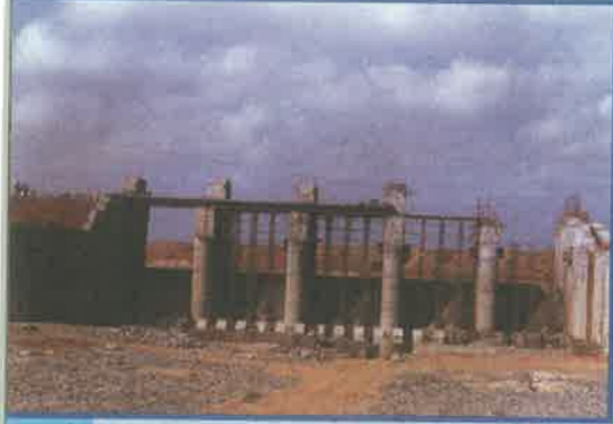
రాళ్లపాడు ప్రాజెక్టు, ప్రకాశం జిల్లా