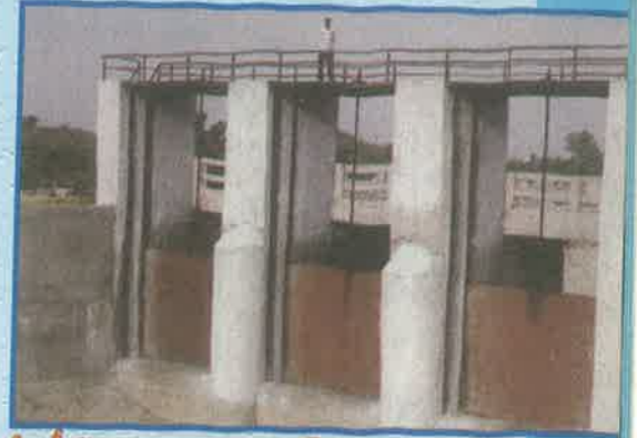
సింగీతం రిజర్వాయర్ ప్రాజెక్ట్, నిజామాబాద్ జిల్లా