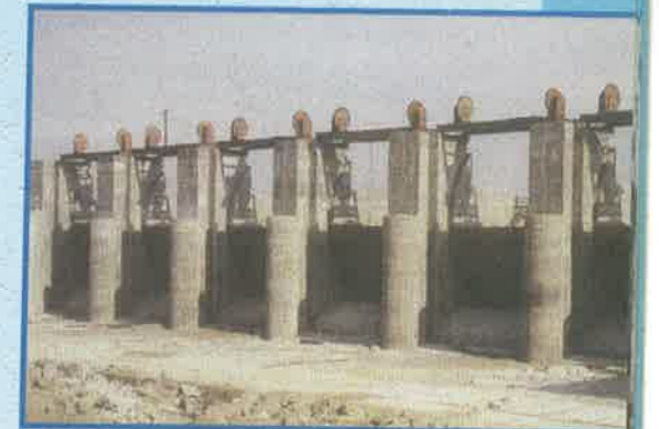
కళ్యాణి వాగు ప్రాజెక్టు, గిజామాబాద్ జిల్లా