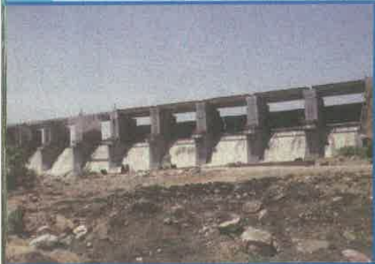
కొలాన్ నాలా ప్రాజెక్టు, నిజామాబాద్ జిల్లా