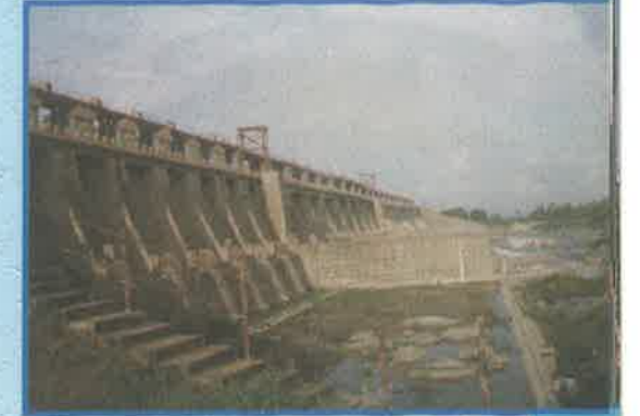
మూసి డ్యాం, నల్గొండ జిల్లా