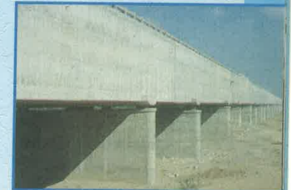
స్వర్ణముఖి తెలుగుగంగ ప్రాజెక్టు, చిత్తూరు జిల్లా