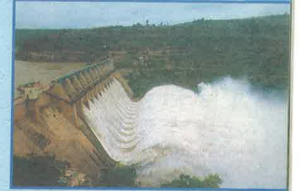
శ్రీశైలం ప్రాజెక్టు, కర్నూలు జిల్లా