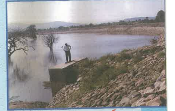
ఎం.ఐ. ట్యాంక్, తలమడుగు, అదిలాబాద్ జిల్లా