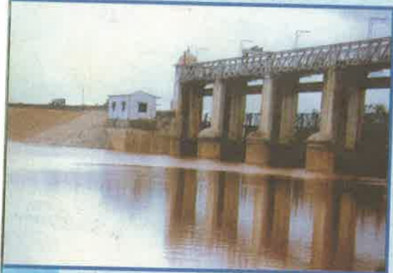
సగిలేరు, కడప జిల్లా