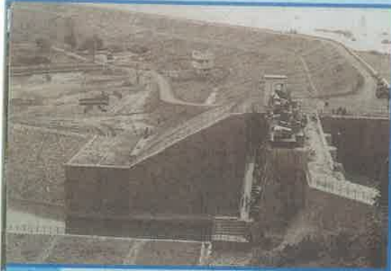
ఆంధ్ర రిజర్వాయర్ ప్రాజెక్టు