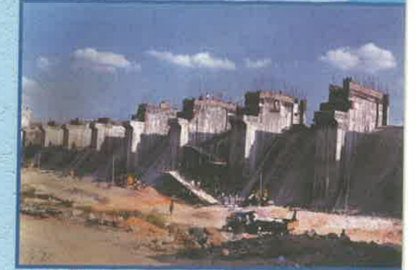
యోగి వేమన రిజర్వాయర్ ప్రాజెక్టు, అనంతపురం జిల్లా