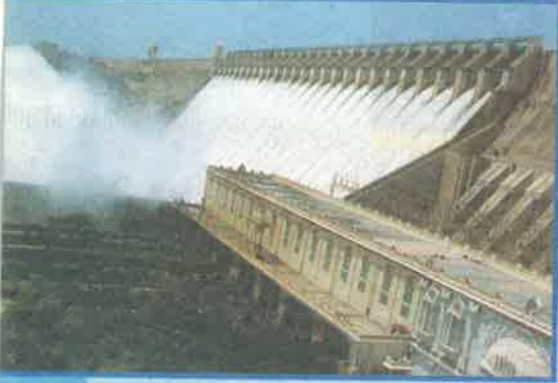
నాగార్జున సాగర్ ప్రాజెక్టు, గుంటూరు జిల్లా