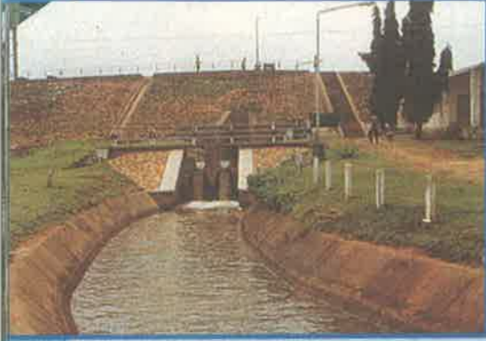
సాత్తాల ప్రాజెక్టు, అదిలాబాద్ జిల్లా