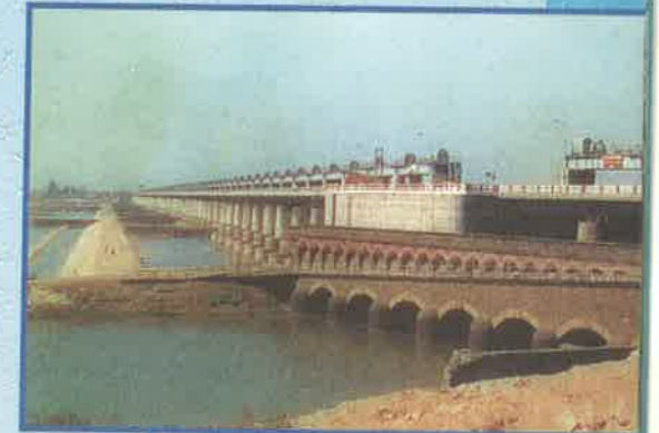
కాటన్ ట్యాంక్, రాజమండ్రి