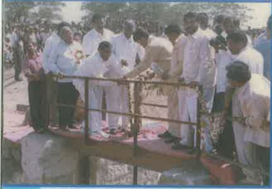
వరంగల్ జిల్లా రేగొండ గ్రామంలో సాగునీటి విడుదల

1999-2000 సంవత్సరంలో రూ. 139.60 కోట్ల వ్యయంతో 17,185 పూర్తి చేశాయి.