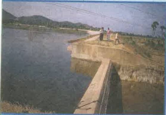
ఎం.ఐ. ట్యాంక్ - లోవగడ్డ, విజయనగరం జిల్లా

★ 18 లక్షల ఎకరాల గావ్ ఆయకట్టును స్థిరీకరించడం జరిగింది.