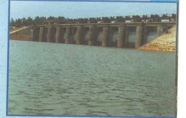
మద్దువలస, ప్రకాశం జిల్లా

★ కుడి ప్రధాన కాల్వ (ఆర్ఎంసి) కింద 36వ కిలోమీటరు నుండి 50.704 కిలోమీటరు మధ్య పనులు, పంటకాల్వల పనులు పురోగతిలో ఉన్నాయి.