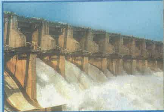
శ్రీరాంసాగర్ ప్రాజెక్టు, కరీంనగర్ జిల్లా