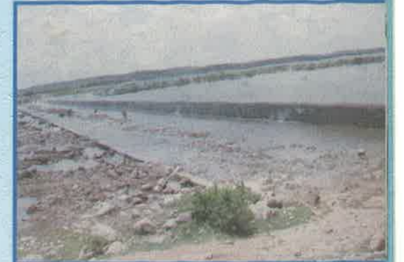
నల్ల వాగు ప్రాజెక్టు, మెదక్ జిల్లా