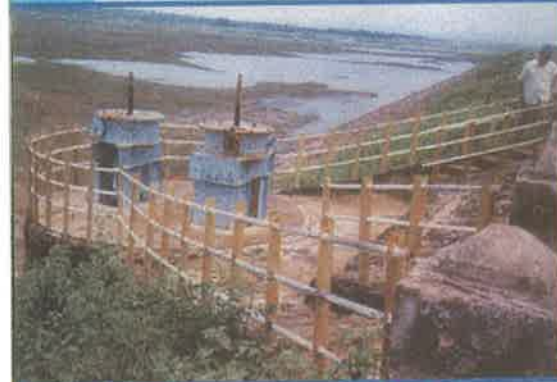
తమ్మిలేరు ప్రాజెక్టు, పశ్చిమ గోదావరి జిల్లా

జంఝావతి ప్రాజెక్టు పెద్దగడ్డ రిజర్వాయర్ తోటపల్లి బ్యారేజీ తారకరామ తీర్థ సాగరం వంశధార I, II దశలు తాటిపూడి లిఫ్ట్ ఇరిగేషన్ పుష్కరం లిఫ్ట్ ఇరిగేషన్ గుండ్లకమ్మ రిజర్వాయర్ ఎస్.ఎస్. లింక్ కెనాల్ వెలిగొండ ప్రాజెక్టు పులిచింతల ప్రాజెక్టు మోపాడు ట్యాంకు అత్తాకోడళ్ల చెరువు