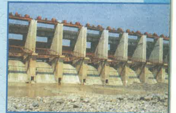
జారాల ప్రాజెక్టు, మహబూబ్ నగర్ జిల్లా