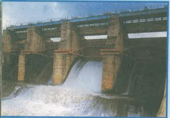
వెంగళరాయసాగరం ప్రాజెక్టు, విజయనగరం జిల్లా