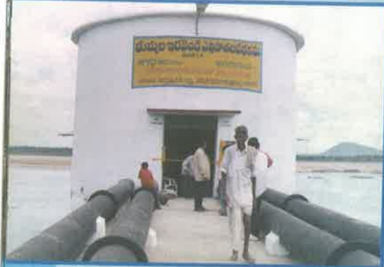
తుమ్మల ఇరవండి ఎత్తిపోతల పథకము, ఖమ్మం డివిజన్