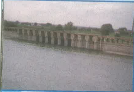
కె.సి.కెనాల్, కర్నూలు జిల్లా