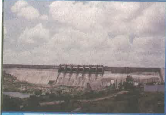
పెన్నా అవోబలం ప్రాజెక్టు, అనంతపురం జిల్లా