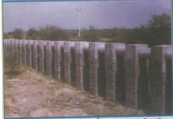
బెత్తెం లిఫ్ట్ ఇరిగేషన్ స్కీం, మహబూబ్ నగర్ జిల్లా