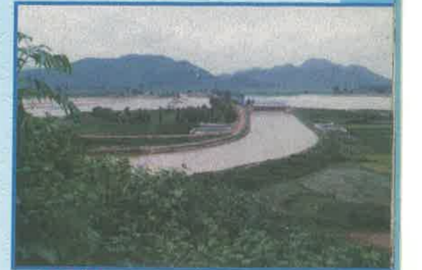
గొట్టా బూరేహ్, శ్రీకాకుళం జిల్లా